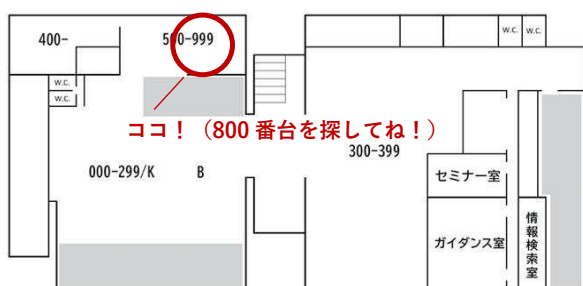
学情 2F 地図

「わざわざ問題集を買いたくない…」 「とにかく数多くの問題を解きたい！」 という方は、ぜひご活用ください！