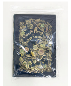
透明の袋に密封されたヒ素を含む本