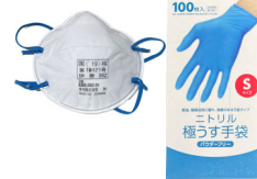
使い捨てマスクは、DS3 (FFP2, NP99等)やDS2 (FFP2, NP95等)などを使いましょう。ニトリル手袋は図書を汚さないようにパウダーフリー(粉無し)のものを使いましょう。

もしあなたの図書館に、ヒ素を含む本、あるいは、ヒ素を含むかもしれない本があったら、どうしたらよいでしょうか？まず、使い捨てのマスク、使い捨てのニトリル手袋(粉なし)等で自分自身をしっかりと防護して、その本を密封できる透明の袋に入れ、隔離しましょう。その本が置かれていた書架の棚板や、隣接していた本の表紙には、ヒ素を含む表紙から出た埃が付着しているかもしれませんので、ペーパータオルなどでそれらを拭きましょう。使用したペーパータオルは、使い捨てマスク、使い捨てニトリル手袋などと一緒にゴミ袋に入れて密封し、有害物質として処理しましょう。隔離した本は、ヒ素を含む(あるいはそのおそれがある)ことを明記したうえで鍵のかかるキャビネット等に入れて、その鍵もきちんと管理しましょう。また、隔離した本の代替物として、デジタルアーカイブのURLや、複製された同一の本を収蔵する図書館を探して、利用者から請求があった際に提供できるようにしておきましょう。